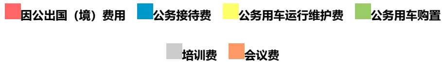
图 3、“三公”经费、培训费、会议费支出预算构成